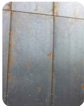
materiál po instalaci

Jednou z možností pro dosažení takového originálního přírodního vzhledu je využití povětrnostně odolné oceli, známé také pod obchodním názvem Corten nebo Atmofix. Jde o patinující ocel, kde se vlivem korozivních stimulátorů (déšť, vlhkost) vytváří na povrchu pasivační ochranná vrstva, lidově známá jako rez.